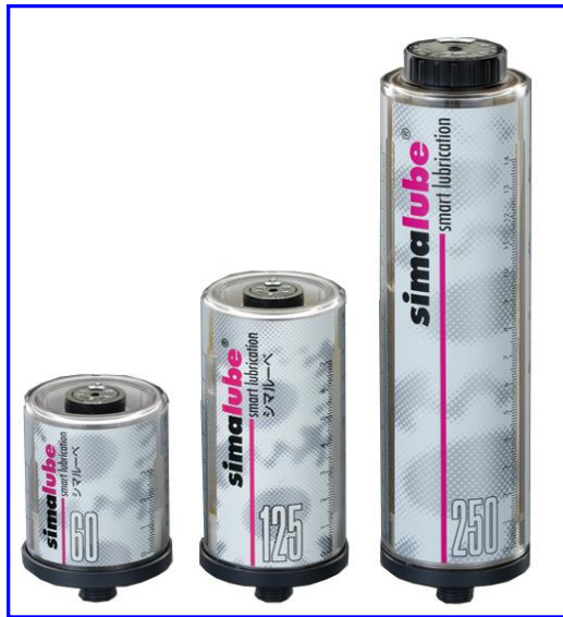
60ml 125ml 250ml